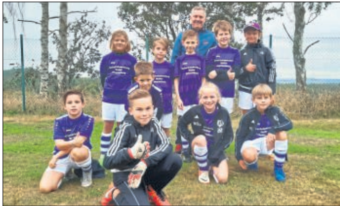
Die siegreichen Jungs und Mädels