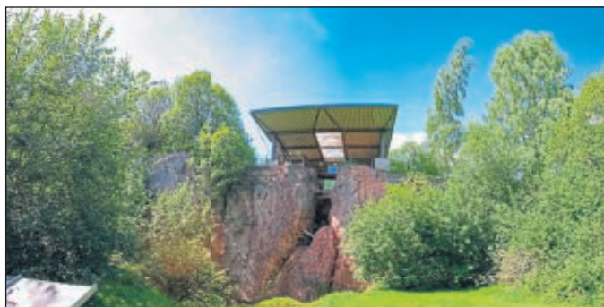
Naturdenkmal Korbacher Spalte