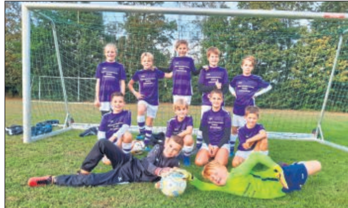
Gut gekämpft - doch knapp verloren