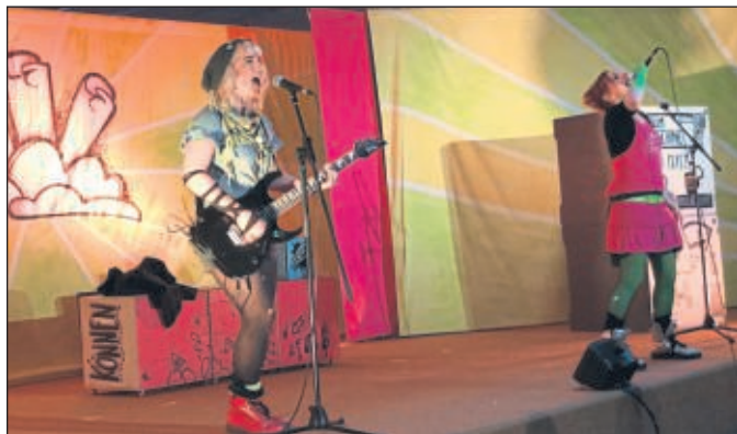
Rockig-punkige Livesongs machten das Musical kurzweilig und jugendnah.

unterhalten und sensibilisiert. Es war ein buntes, schrilles und vergnügliches Musical, das das komplexe Thema „Globalisierung und Verantwortung“ auf jugendgerechte Weise erklärt und Mut und Lust gemacht hat, selbst aktiv und kreativ zu werden. Das fanden auch die Schüler der THS und waren anschließend nicht nur vom Stück begeistert, sondern auch von der Thematik sehr ergriffen. „Echt krass, wie gut es uns geht und mit wie wenig viele andere auf der Welt auskommen müssen...!“, bemerkte ein Schüler. Fünf andere Schülerinnen wiederum fingen direkt an, aktiv zu werden und verabredeten sich fürs Wochenende zur Kleidertauschparty. „Jeder von uns hat so viele Klamotten und dabei ziehen wir doch immer wieder nur die gleichen Sachen an. Anstatt dass wir uns ständig zum Shoppen treffen und Neues kaufen, tauschen wir jetzt einfach mal!“ Und so sprudelte es aus den Jugendlichen nur so hervor. Plötzlich waren sie voller Eifer und Ideen, wie man mit einfachen Mitteln dazu beitragen kann, die Ungerechtigkeit auf der Welt nicht weiter auszubauen, sondern dem entgegenzuwirken. Wie schon das Stück besagt: Du kannst etwas bewirken, egal wie klein. Sei eine Mücke und bewege den Elefanten!