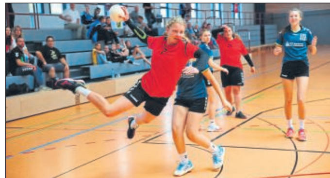
Durchbruch auf der Aussenposition