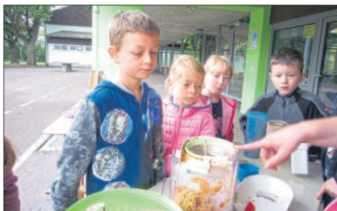
So funktioniert das mit dem Apfelsaft pressen