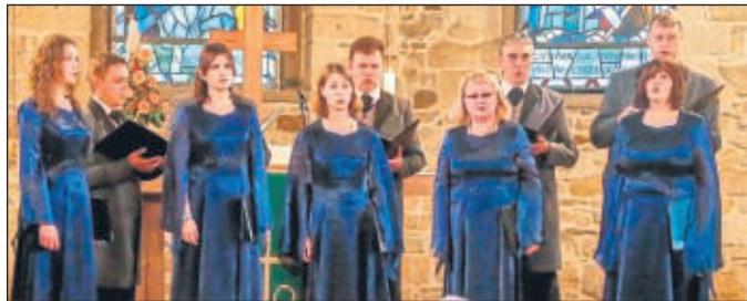
Chor der Minsker Kirchengemeinde „Aller Betrübten Freude“ singt in der Hooper Kirche am 13.10.2019 um 17 Uhr.

Chorkonzert in der Hooper Kirche am 13. Oktober um 17 Uhr (Eintritt frei, Spende erbeten)