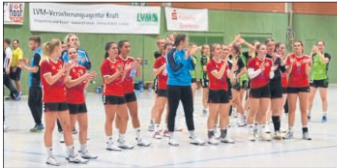
Dank an das engagierte Publikum