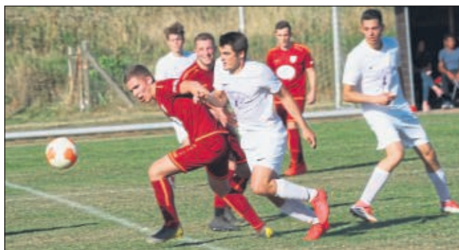
Kampf um die Kugel