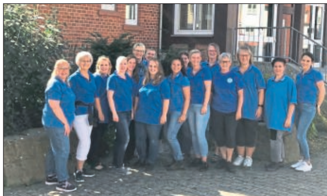
Das Team der Kindertagespflege am Samstag zum Familiennachmittag

Am vergangenen Samstag war es dem Team der Kindertagespflege Baunatal-Schauenburg e.V. eine besondere Freude zahlreiche kleine und große Gäste zu ihrem Familiennachmittag im Kirmeszelt begrüßen zu dürfen. Im Zelt gab es die Möglichkeit zu einem gemütlichen Kaffee trinken und das vielfältige Kuchenbuffet wurde sehr gut angenommen.