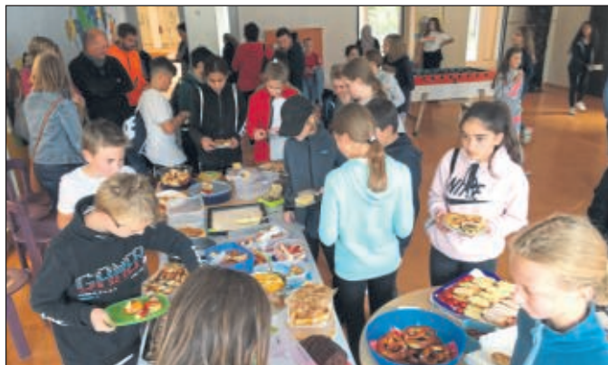
Nach dem Rennen wartete ein üppiges Buffet auf die Sportler.

Seit vielen Jahren unterstützen Schüler der THS Kinder in Afrika, genauer gesagt die Partnerschule in Chibuto - Mosambik. Auch in diesem Jahr setzte sich der Jahrgang 6 für diese Schultradition ein. So fand am 19.09.2019 ein erfolgreicher Spendenlauf im Stadtpark statt. Seit August warben die Kinder Sponsoren, die ihnen für jeden gelaufenen Kilometer einen bestimmten Geldbetrag spendeten. Der Spendenlauf war Teil eines Projekttag, an dem sich alle 6. Klassen intensiv mit den Lebensbedingungen und Zukunftschancen von Kindern in Mosambik beschäftigten. Während eines informativen Vortrages haben die Schüler Informationen über ihre Partnerschule in Chibuto - Mosambik erhalten. Dabei haben sie auf Bildern gesehen, in welcher Armut die Kinder in Chibuto leben, aber auch, wofür die erlaufenen und gesammelten Gelder eingesetzt werden. Zum Abschluss des Projekttag konnten sich Läufer und Unterstützer an einem internationalen Buffet stärken, das von Eltern der Schüler organisiert wurde. Ein herzliches Dankeschön gilt allen, die zum Gelingen des Spendenmarathons beigetragen haben!