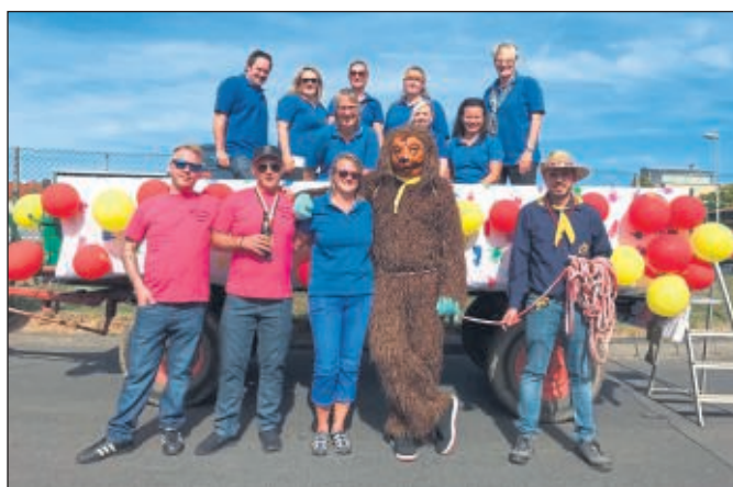
Und kurz vor der Abfahrt im Kirmesumzug