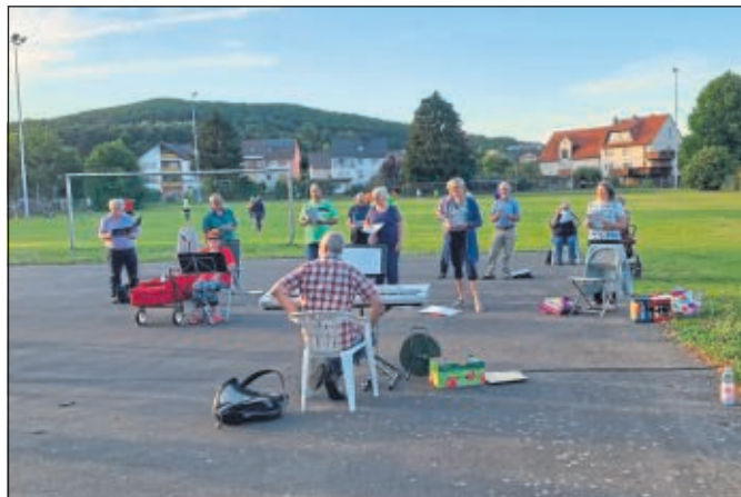
Die neue Normalität - Singen hinter'm Fußballtor

probt aus den bekannten Gründen bis auf Weiteres – und solange das Wetter mitspielt – draußen (am Sportplatz), und zwar am Mittwochabend ab ca. 19:15 Uhr.