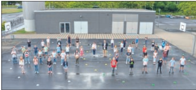
Schülerinnen und Schüler des neuen Jahrgangs 5 mit ihren Klassenlehrern

Nachdem das erste gemeinsame Klassenfoto im Kasten war, freuten sich die Kinder über den frühen Schulschluss und waren voller Tatendrang für den nächsten Tag, ihren ersten „richtigen“ Schultag an der EKS. Allen neuen Schülerinnen und Schülern sowie deren Eltern wünschen wir eine gute und erfolgreiche Zeit an der EKS.