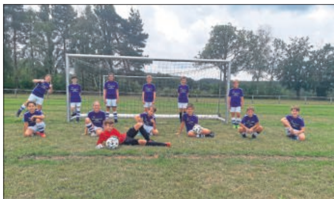
Auch beim Gruppenfoto wird Abstand gehalten!