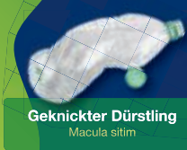
Geknickter Dürstling Macula sitim