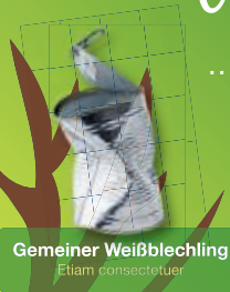
Gemeiner Weißblechling Etiar consecetuer