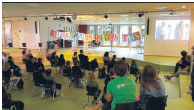
Eltern und Schüler lauschen gespannt dem musikalischen Videoeinspieler bei der Aufnahmefeier.

Nach dem ersten Kennenlernen in den Klassen trafen sich Eltern und Schüler mit ihren Sonnenblumen zur Fotoaktion auf dem Schulhof. Anders als sonst üblich hatte dieses Jahr jede Klasse einen eigenen Fototermin und ihre ganz eigene kleine Aufnahmefeier. Trotz der Hygieneauflagen waren alle Schüler und Eltern begeistert von der herzlichen Atmosphäre. Die Theodor-Heuss-Schule sagt allen Mitwirkenden herzlichen Dank und freut sich auf ein gutes Schuljahr für alle.