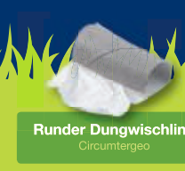
Runder Dungwischling Circumtergeo