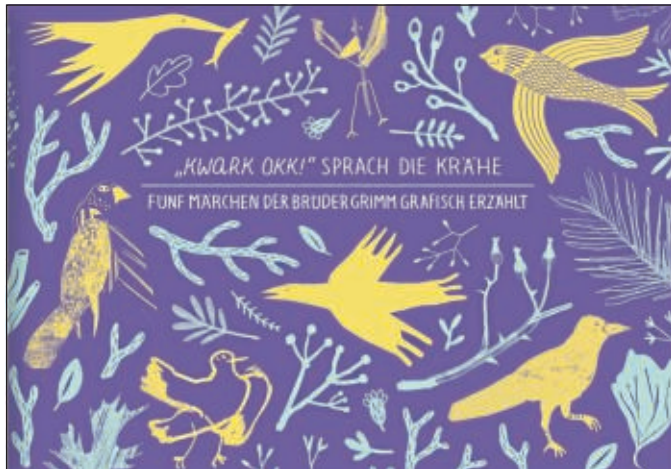
Cover: „KWARK OKK!“ SPRACH DIE KRÄHE