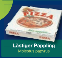
Lästiger Pappling Molestus papyrus