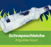
Schnapsschleiche Anguidae liquor