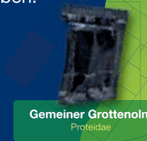
Gemeiner Grottenolm Proteidae