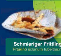
Schmieriger Frittling Praelino solanum tuberosum