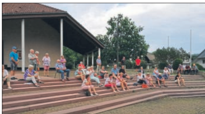
Auf der Treppe vor der Schauenburghalle hat sich der Chor der FKS Hoof... getroffen und sich ausgetauscht.

Am Sonntag, 27. September 2020 möchte der Verein mit allen Mitgliedern in der Gaststätte Himmel essen gehen. Hier sind auch alle passiven Mitglieder schon heute recht herzlich eingeladen. Näher Informationen gibt es demnächst hier im Kurier oder auf unserer Homepage.