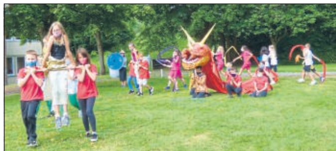
Vorführung der Klassen 4

Einschulung der neuen Erstklässler in der Marie-Hassenpflug-Schule bei herrlichem Sonnenschein