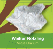
Weißer Rotzling Vetus Orarium