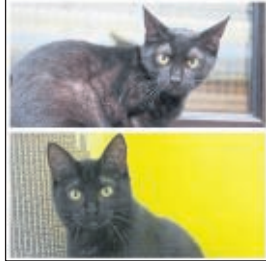
Saliva und Savi

Marley ist eine traumhafte Hündin: anhänglich, verschmust und treu. Sie ist lernwillig und hat großes Potenzial. Für sie suchen wir ein Zuhause bei hundeerfahrenen Menschen, ohne Kinder oder andere Tiere im Haushalt. Sie sollten Spaß und Freude an der Ausbildung eines jungen Hundes haben. Viel Geduld, Zeit und Energie wird nötig sein, um das Versäumte aufzuholen und aus ihr eine glückliche und ausgelastete sowie eine gut erzogene Hündin zu machen. Schäferhundtypisch wird sie bereit sein, alles für sie zu tun, um ihnen zu gefallen. Möchten Sie Marley kennenlernen, dann rufen Sie uns an oder schreiben eine Mail.