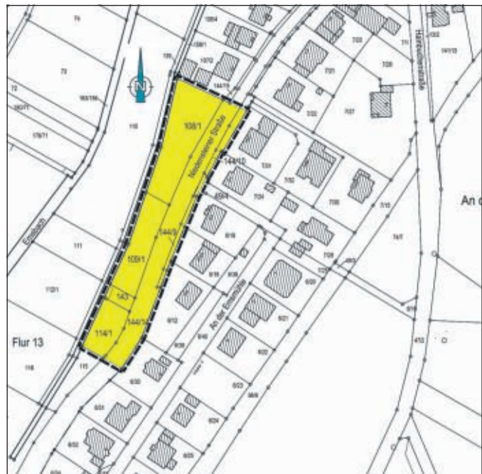
BPlan 67: Übersichtsplan ohne Maßstab

Das Verfahrensgebiet des Bebauungsplanes befindet sich in der Gemarkung Breitenbach und umfasst die in der Flur 13 liegenden Flurstücke 108/1, 109/1, 114/1 und 143.