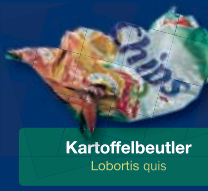
Kartoffelbeutel Lobortis quis