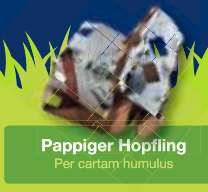
Pappiger Hopfling Per cartam humulus